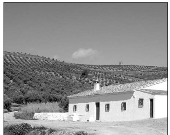
Panorámica del yacimiento de Torreparedones. En primer término, el Cortijo de las Vírgenes.

Las jornadas se iniciaron con una conferencia inaugural, a cargo de la directora del Conjunto Monumental y de la Alhambra y Generalife, y contaron con dos ponencias, de gran interés, acerca del modelo de gestión de los Parques Culturales de Aragón y sobre el consorcio monumental de la ciudad romana de Pollentia (Alcudia, Mallorca).