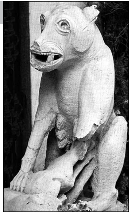
Loba del Cerro de los Molinillos.

de los Molinillos está dentro del ambiente helenístico, y se podría fechar en los siglos III-II a.C. Probablemente, formó parte de la decoración de una tumba perteneciente a personaje destacado de las élites aristocráticas que habitaron en aquella importante urbe situada junto al río Guadajoz.