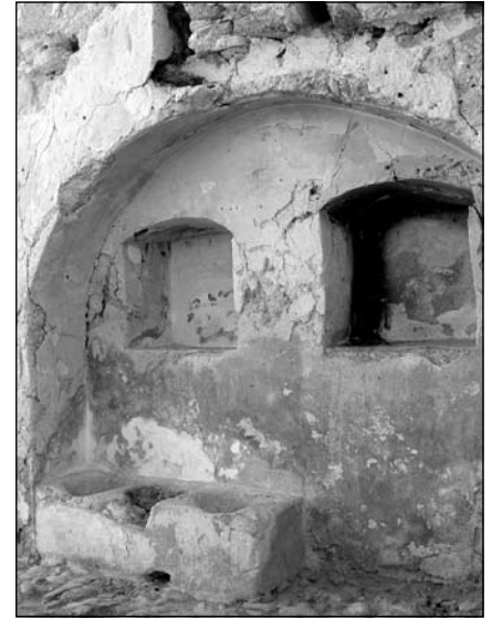
Detalle de una de las dependencias descubiertas.

proceso de excavación. La característica principal de estas dependencias radica en la existencia de un suelo de ocupación elaborado a base de cantos, que, en la mayoría de las ocasiones, van en el mismo sentido y con una pendiente algo pronunciada, lo que parece indicar cual era el recorrido de las aguas residuales en el interior del castillo. Además, se ha localizado una canalización en este sector N. del edificio cuyo trazado atraviesa el portillo descubierto en esta misma fase y que indica que las aguas residuales no vertían al centro de la plaza del castillo, sino que existirían canalizaciones que vertían al exterior del mismo, por lo menos una para cada fachada.