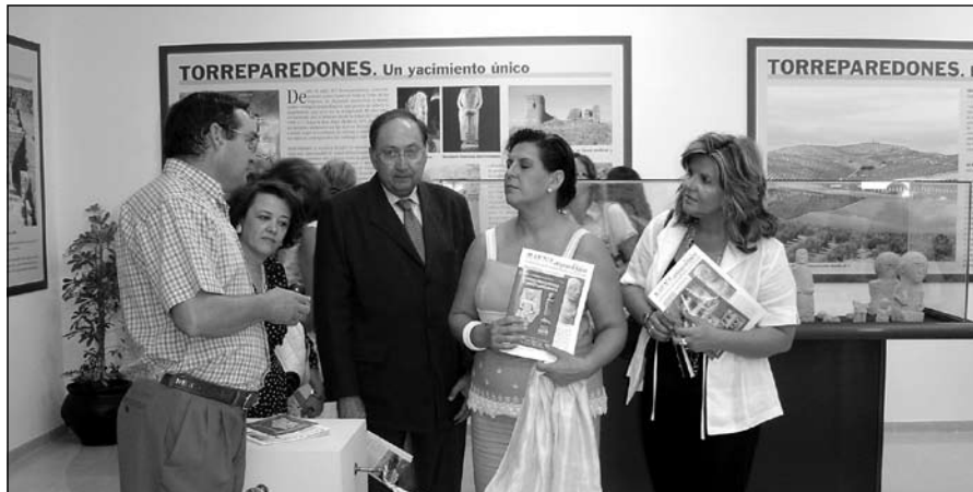
Autoridades durante la exposición sobre Torreparedones.