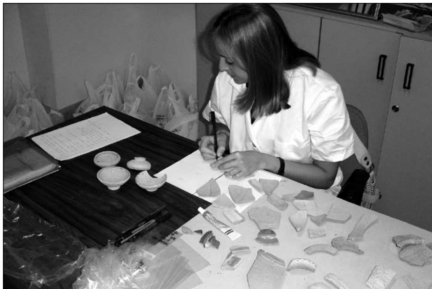
Siglado de materiales arqueológicos en el museo

El camino de acceso a Torreparedones se encuentra, a fecha de hoy, en perfecto estado para el tránsito de vehículos. Se han reparado cunetas, construido varios badenes y mejorado el firme culminado con una capa de asfalto. Las obras comenzaron el pasado mes de junio y gracias a la colaboración de la Consejería de Agricultura y la Excm. Diputación Provincial, junto con fondos europeos, por un importe total de 250.000 euros, el citado camino permite llegar al yacimiento con turismos y autocares, en este último caso, hasta el cortijo de las Vírgenes, de momento. En breve se reparará el tramo del primer camino que, al tratarse de una vía pecuaria, necesita de una actuación separada y un tratamiento distinto. Con estas actuaciones quedará garantizado el acceso al yacimiento y se cumple así con una de las principales actuaciones contempladas en el plan director del yacimiento en materia de infraestructuras.