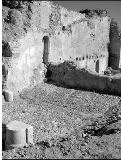
Estructuras exhumadas en el interior del lienzo N. del castillo de Baena.

En este sentido cabe destacar la aparición de seis nuevos espacios, todos relacionados entre sí, divididos por paredes levantadas con mortero y yeso con muy mala calidad e incluso con problemas de estabilidad en algunos casos. Se trata, sin duda, de una compartimentación de los espacios realizada a fines del s. XX por los moradores del recinto para separar los animales. Esta cuestión queda corroborada con los continuos pesebres y alacenas para almacenamiento que se han hallado durante todo el