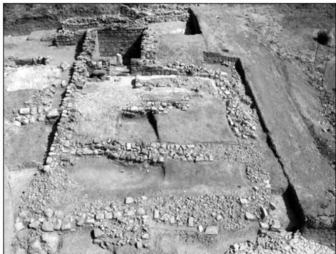
Panorámica del santuario.