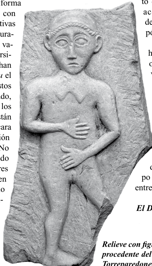
Relieve con figura femenina procedente del santuario de Torreparedones.