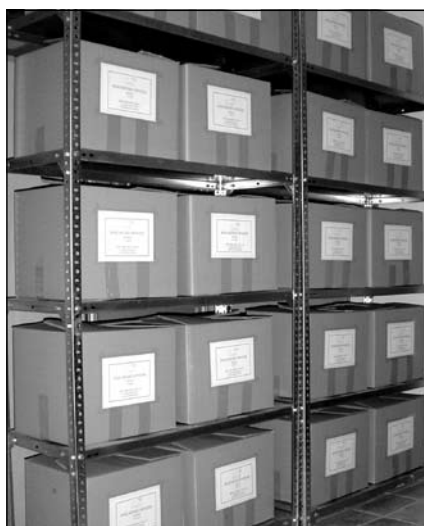
Detalle del almacén del museo.

Gracias a una subvención concedida por ADEGUA al Excmo. Ayuntamiento para realizar trabajos de apoyo a la investigación arqueológica en Torreparedones, se está llevando a cabo, desde el Museo Histórico Municipal, la limpieza y siglado de las piezas extraídas en la actividad arqueológica puntual de la puerta oriental y del santuario. Los materiales arqueológicos que se recogen en toda excavación deben ser, convenientemente, lavados con agua y siglados para que, en todo momento, se puedan identificar (v.g. TP/06/5A/43/1287). Así, cada pieza incorpora una numeración en la que se detalla la signatura del yacimiento, el año, el corte y la unidad estratigráfica correspondientes y el número de orden. Hasta la fecha se han siglado todas las piezas recogidas en la puerta