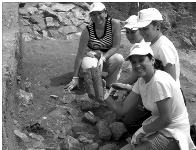
Hallazgo de exvotos in situ en el santuario.

de Córdoba y pretenden esclarecer determinadas cuestiones básicas a la hora de afrontar el proyecto de restauración. Por un lado, se trata de determinar la cota del suelo del patio interior del castillo, la limpieza del interior de la torre del homenaje para conocer su pavimento, así como del aljibe localizado en el citado patio, y documentar el foso que rodeaba el castillo por tres de sus lados, el E., O. y S. Además, se intentará verificar la ubicación del acceso tanto al castillo como al interior de la torre del homenaje.