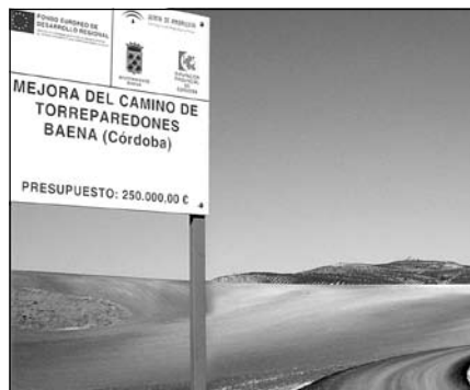
Camino de Torreparedones.

El camino de acceso a Torreparedones se encuentra, a fecha de hoy, en perfecto estado para el tránsito de vehículos. Se han reparado cunetas, construido varios badenes y mejorado el firme culminado con una capa de asfalto. Las obras comenzaron el pasado mes de junio y gracias a la colaboración de la Consejería de Agricultura y la Excm. Diputación Provincial, junto con fondos europeos, por un importe total de 250.000 euros, el citado camino permite llegar al yacimiento con turismos y autocares, en este último caso, hasta el cortijo de las Vírgenes, de momento. En breve se reparará el tramo del primer camino que, al tratarse de una vía pecuaria, necesita de una actuación separada y un tratamiento distinto. Con estas actuaciones quedará garantizado el acceso al yacimiento y se cumple así con una de las principales actuaciones contempladas en el plan director del yacimiento en materia de infraestructuras.