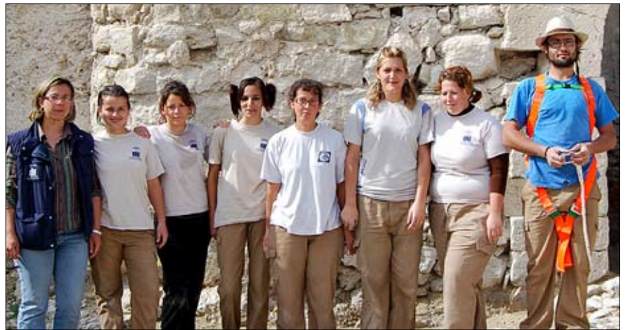
Alumnos y monitora de arqueología de la escuela taller Plaza Palacio.

Los cuatro módulos se han puesto en marcha con un porcentaje femenino entre el alumnado del 62%, con presencia de alumnas en cada uno de los módulos, y con los objetivos de actuación de las fases prácticas (todos los módulos salvo el de geriatría) en el entorno de la Plaza de Palacio y, en mayor medida, en las dependencias del Castillo Fortaleza de la