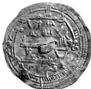
Dirham n° 12. Anverso