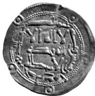
Dirham n° 3. Anverso

Hacia 1985, al N. de Baena, en unos olivares cercanos al Cortijo de Izcar, se descubrió fortuitamente, durante los trabajos de laboreo, un tesoro de monedas de plata emirales no asociado a ningún otro resto arqueológico. Estaba compuesto por un total de cincuenta dirhames del Emirato Independiente cuya cronología está comprendida entre el año 162/778-9 y el 272/885-6. Corresponden, por tanto, a los gobiernos de ‘Abd al-Rahmān I (1 pieza, 2%), al-Hakam I (8 piezas, 16%), ‘Abd al-Rahmān II al-Mutawassit (16 piezas, 32%) y Muḥammad I (25