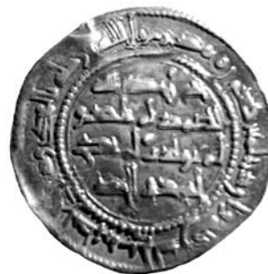
Dirham n° 3. Reverso