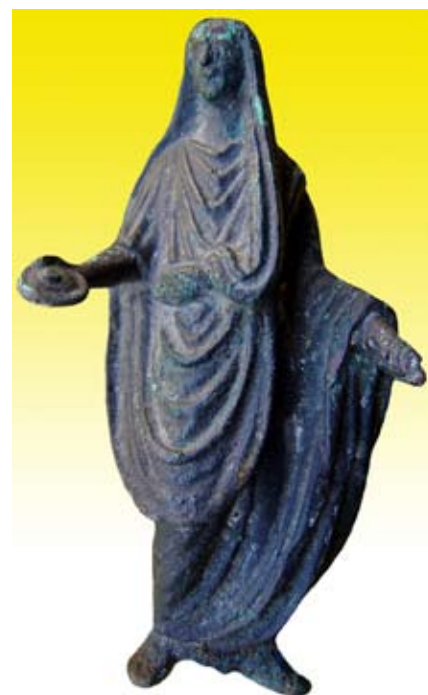
Figura togada capite velato de bronce donada por D. Virgilio Olmo.

En el presente número se da cuenta de las noticias de actualidad y hechos acontecidos durante estos meses como la exposición sobre las excavaciones de Torreparedones que tuvo como escenario el Museo del Olivar y el Aceite, la presentación del proyecto del parque arqueológico de dicho yacimiento en Fitur, una breve reseña de los resultados de la primera fase de excavación del castillo de Castro