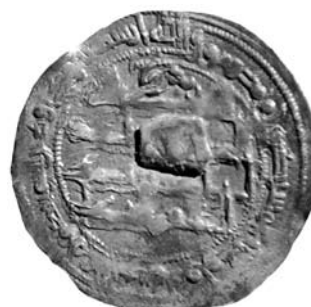
Dirham n° 12. Reverso

piezas, 50%), siendo las de este último emir las más numerosas. Llama la atención la existencia de la pieza del año 162/778-9 ya que se trata de una fecha muy temprana teniendo en cuenta que el siguiente año registrado es el 190/805-6, y que no aparece ningún ejemplar del gobierno de Hišām I (172-180/788-796). Sin embargo, no es la primera vez que esto ocurre en hallazgos del Emirato. Cabe destacar también que cinco de estas piezas están horadadas: dos de ellas (n° 20 y 15) con una y dos perforaciones circulares respectivamente; y las tres restantes (n° 12, 13 y 35)