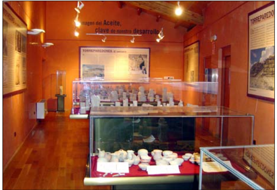
Exposición sobre Torreparedones en el Museo del Olivar y el Aceite.

El alcalde expuso el interés por continuar con la recuperación del yacimiento de Torreparedones y precisó que el esfuerzo económico realizado hasta ahora había recaído en el consistorio baenense; así mismo, animó al regidor de Castro a participar en el proyecto, pues bue-