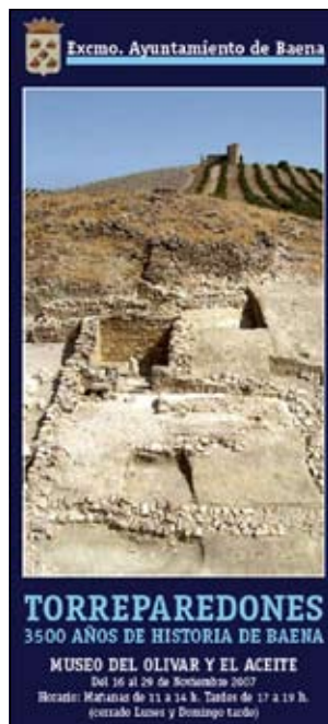
Detalle de la excavación.

La intervención arqueológica llevada a cabo el pasado verano ha servido para poner de evidencia algunos extremos de interés relacionados con el origen y los rasgos