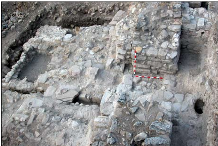
Detalle de la excavación.

En la zona de la Plaza de Armas se procedió a la limpieza y desescombro del relleno acumulado en el interior del aljibe, apareciendo una bien conservada estructura de 2,85 m. de profundidad y 3,20 x 2,35 m.