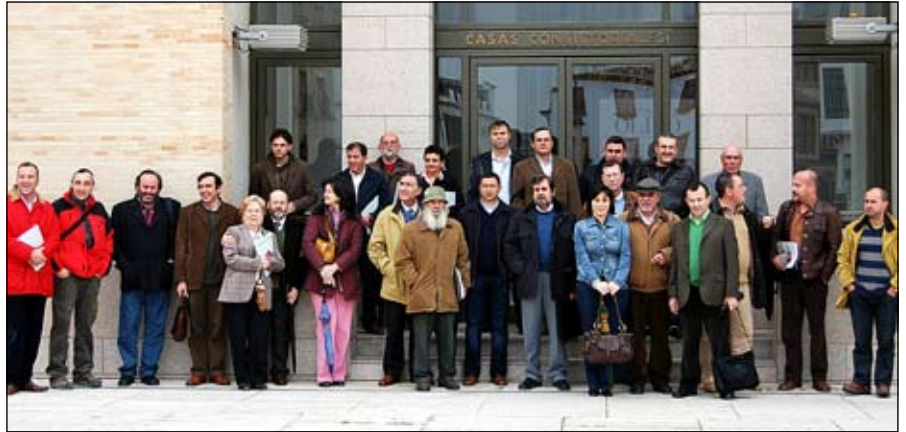
Directores y responsables técnicos de los museos locales cordobeses ante la fachada del Ayuntamiento.