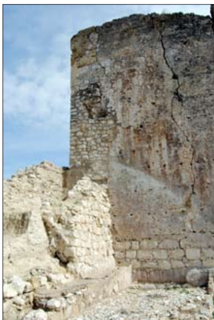
La Torre de los Secretos tras la excavación.

La llamada Torre de los Secretos se ubica en la esquina SE. del castillo y es una construcción de planta